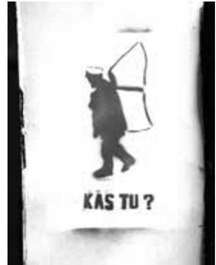
Wer bist Du?